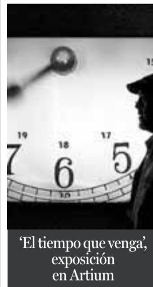
'El tiempo que venga', exposición en Artium

ERASE UNA VEZ LA CATEDRAL cuatro categorías distribuidas de la siguiente forma: jóvenes de entre 12 y 17 años y mayores de 18 años que pueden presentar obras en castellano o en euskera. La base fundamental del argumento deberá ser el templo vitoriano, su historia, su entorno y su recuperación, y los relatos no podrán superar las diez páginas. Sólo serán admitidos trabajos inéditos y originales que no hayan sido premiados en otros certámenes. Cada autor podrá presentar un máximo de dos trabajos. Habrá que entregar los textos en la sede de la Fundación (Plaza de las Brullerías, s/n) de lunes a viernes en horario de 10.30 a 14.00 h. y de 16.00 a 20.00 h. Bases y más información: www.catedralvitoria.com o en el teléfono 945 12 21 60. Se podrá presentar los textos hasta el 27 de noviembre.