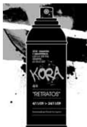
'Retratos' de Kora, en el café Dublin

BIBAT (MUSEO DE ARQUEOLOGÍA Y NAIPES DE ÁLAVA) (Cuchillería, 54) Historia de su historia . Pretende dar a conocer la trayectoria de los museos de Arqueología y Fournier. La muestra estará abierta hasta octubre. Además, se muestra de forma especial el original manuscrito de Lazarraga, que se acompaña con una reproducción y un vídeo explicativo. Horario de martes a viernes de 10.00 a 14.00 y de 16.00 a 18.30