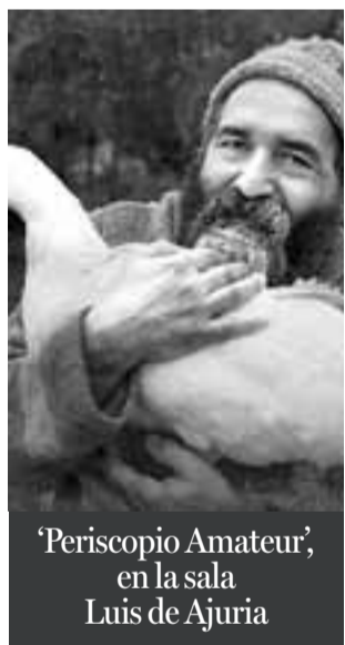
'Periscopio Amateur', en la sala Luis de Ajuria

ENCUADRES DE IMPROVISACIÓN Exposición pictórica a cargo del colectivo CMY. El horario de visitas es de 19.00 horas a 21.30 horas de lunes a viernes. En la Escuela de Artes y Oficios (Conde de Peñaflores, s/n). Hasta el 20 de noviembre.